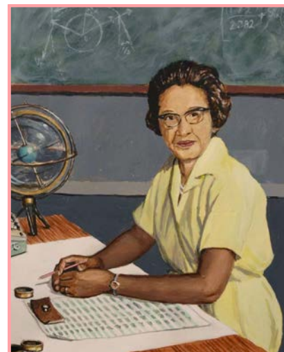
Illustration : Saatchi Art

Elle contribuera par la suite à la synchronisation de calculs pour les missions Apollo et la navette puis prendra sa retraite en 1986 après avoir écrit ou co-écrit 26 rapports et recherches, et travaillé pendant 33 ans à la NASA. Johnson reçoit la médaille présidentielle de la liberté par Barack Obama, la plus haute distinction civile américaine et devint l'une des trois héroïnes du livre et du film Hidden Figures . Elle s'éteint le 24 février 2020 laissant derrière elle un patrimoine exceptionnel et une trace inspirante pour les générations à venir.